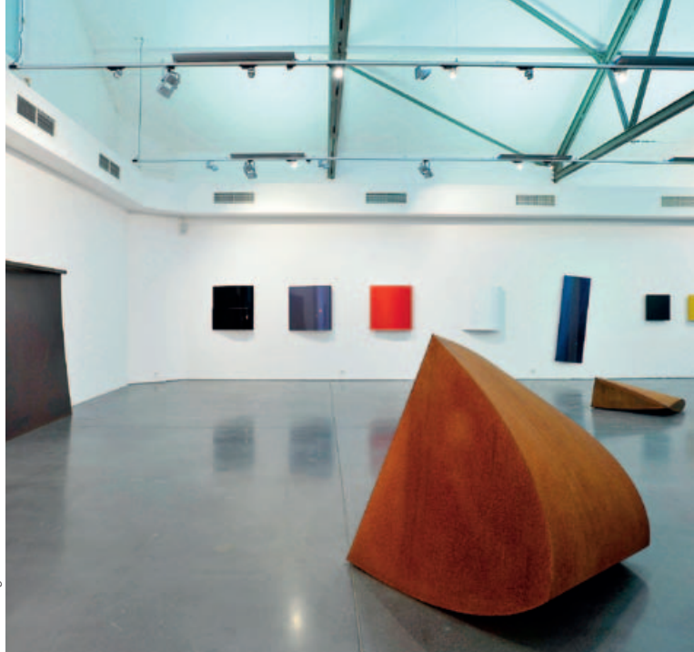
Titelbild: Holger Schimkat