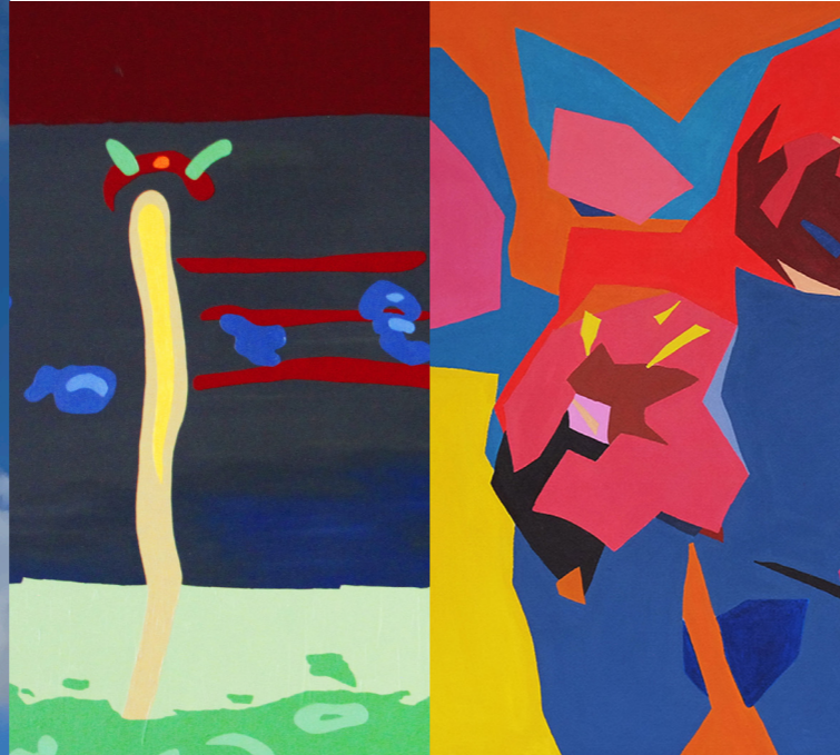
© links: Bertold Becker »Die Komödie«, rechts: Tom Schlang »Spring Jump«

Unter dem Titel »Time out« spannt die Ausstellung einen Bogen von kinetischen Installationen und Figuren bis zu hin zu großformatigen Zeichnungen und Stoffarbeiten, die um Zeit, Erinnern und Identität kreisen.