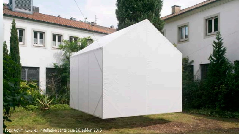
Installation santa casa Düsseldorf 2015